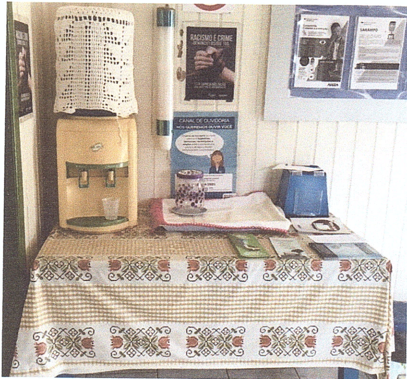
Figura 2 - Disponibilidade de bebedouro.