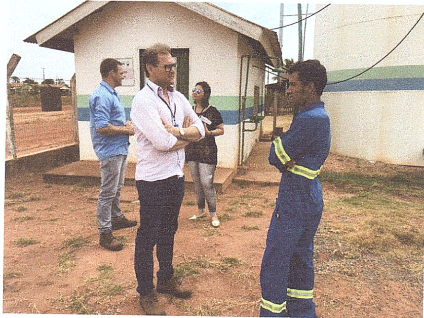
Figura 6 - Visita à Estação de Tratamento de Água.