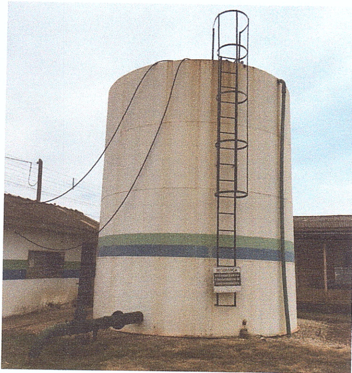
Figura 15 - Reservatório de água de capacidade de 100m 3 .