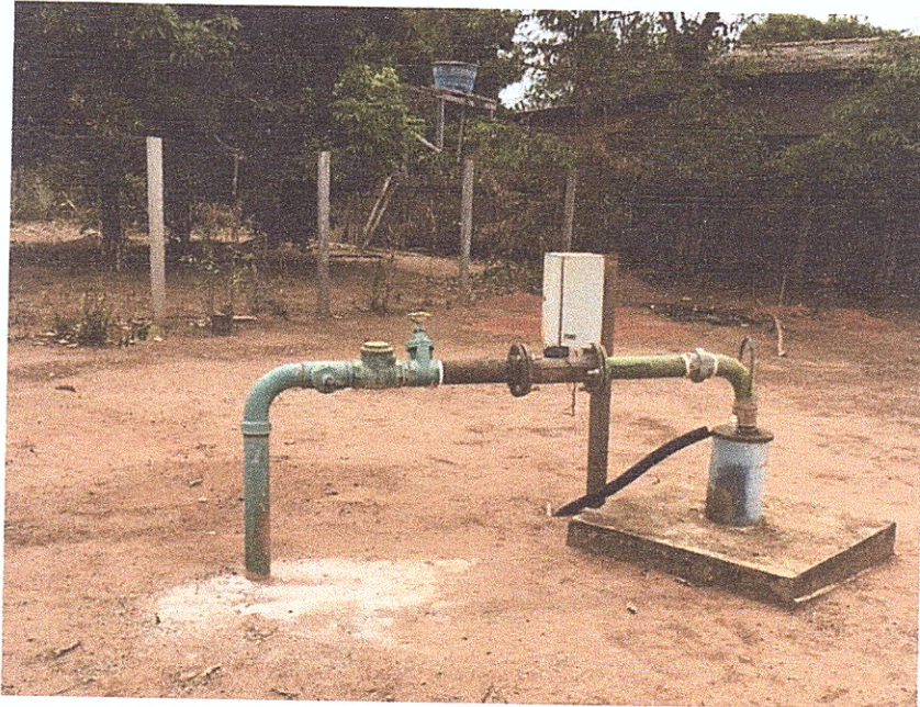
Figura 8 - Poço de captação de água.