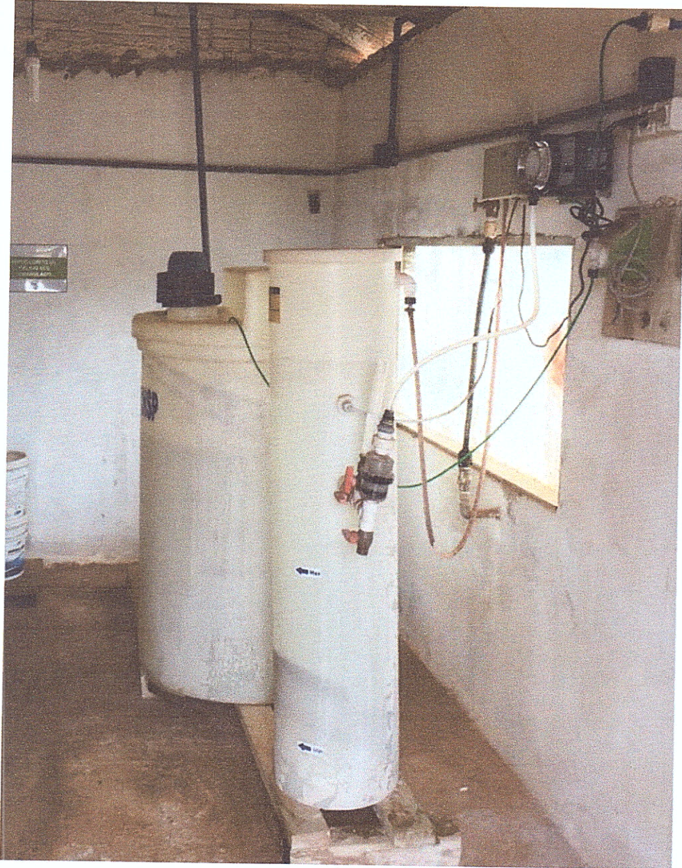
Figura 12 – Sistema de tratamento de água, com aplicação de cloro e flúor.