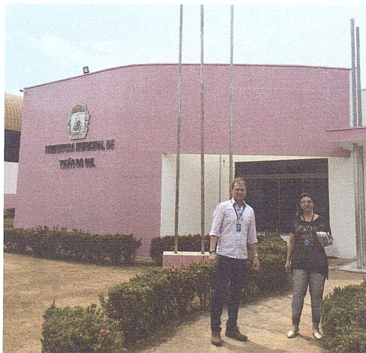
Figura 17 - Visita à Prefeitura de União do Sul.