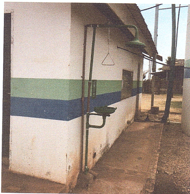
Figura 14 - Chuveiro de segurança e lava-olhos.