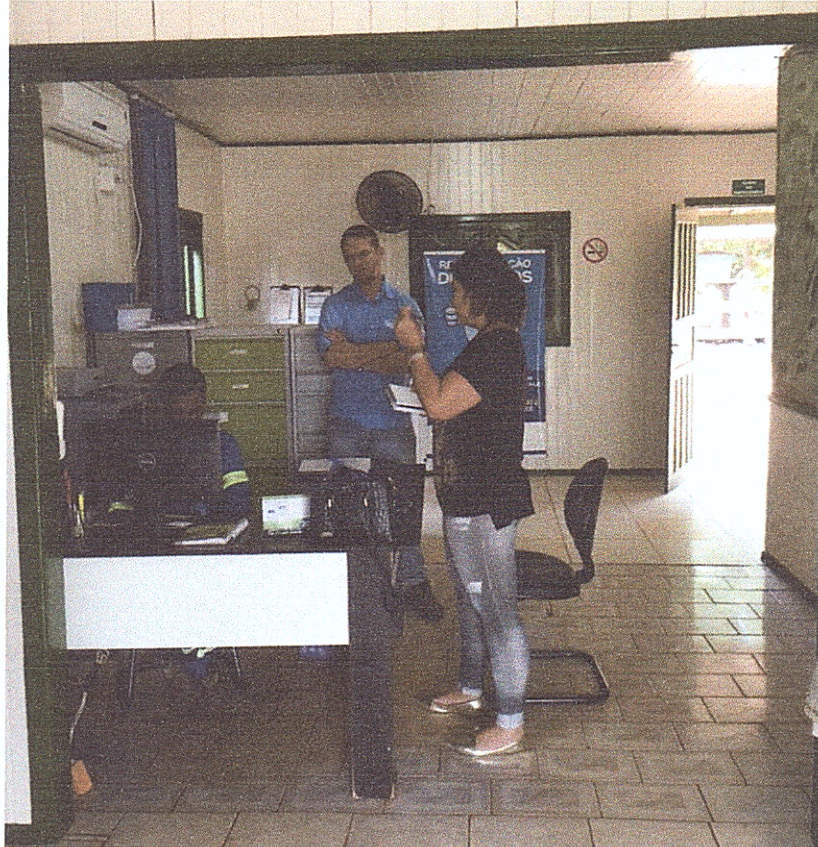
Figura 4 - Escritório de atendimento com ventilador e ar condicionado.