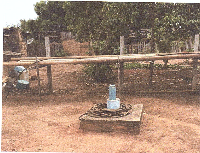
Figura 9 - Poço de captação reserva.