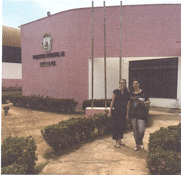
Figura 16 - Visita à Prefeitura de União do Sul.