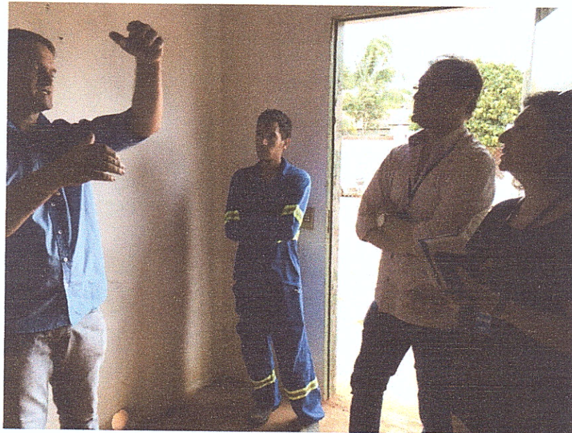
Figura 11 - Explicação dos funcionários da Concessionária Águas de União do Sul.