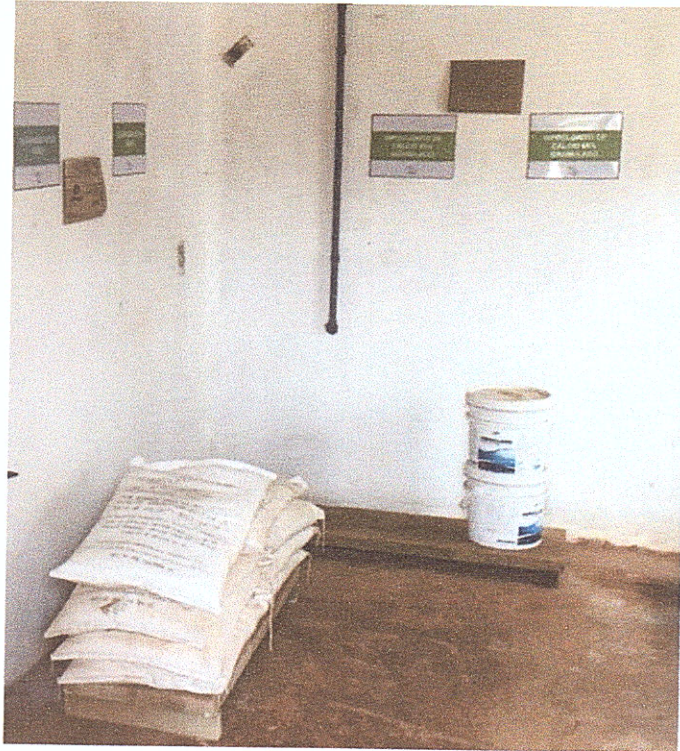
Figura 13 - Armazenagem de produtos químicos com identificação.