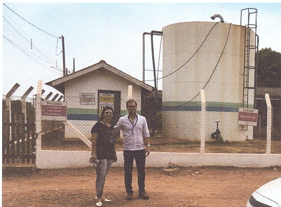
Figura 5 – Visita à Estação de Tratamento de Água.

A casa de produtos químicos, onde estão instalados os equipamentos para tratamento da água e ocorre manuseio dessas substâncias, tais como cloro e flúor, possui chuveiro de segurança e lava-olhos, que funciona como plano de contingência em caso de acidente, evitando maiores danos à saúde dos operadores, em casos de contato com substâncias contaminantes. Os produtos químicos são armazenados no local com identificação.