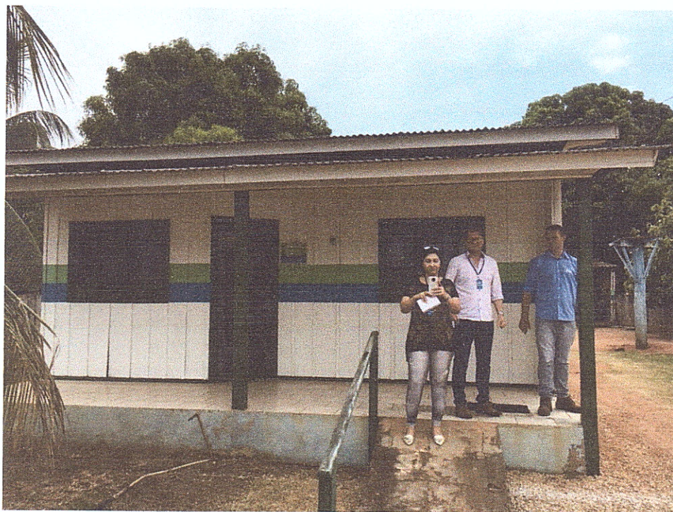
Figura 1 - Fachada do escritório de atendimento aos usuários.

Em visita à agência de atendimento da prestadora de serviços Águas de União do Sul, foi possível verificar que o local apresenta fachada com identificação e dispõe de um ambiente limpo, arejado, com as seguintes estruturas: ar condicionado, bebedouro, banheiro e assentos reservados para idosos, pessoas com deficiência ou mobilidade reduzida, gestantes, lactantes, e pessoas com crianças de colo. Portanto, apresenta ambiente adequado para realizar atendimento aos usuários dos serviços prestados.