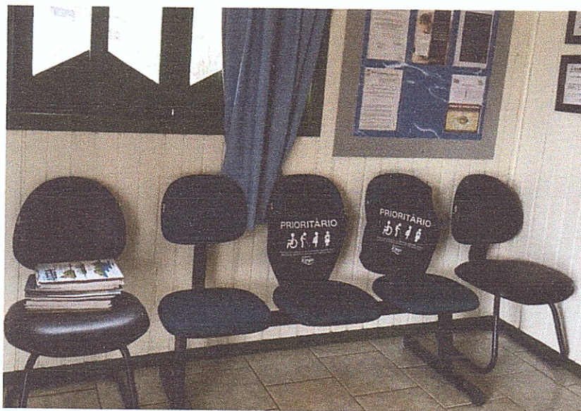
Figura 3 - Assentos prioritários.