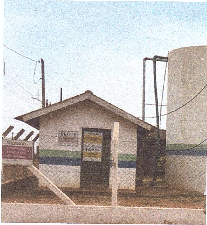
Figura 10 - Casa de Produtos Químicos.