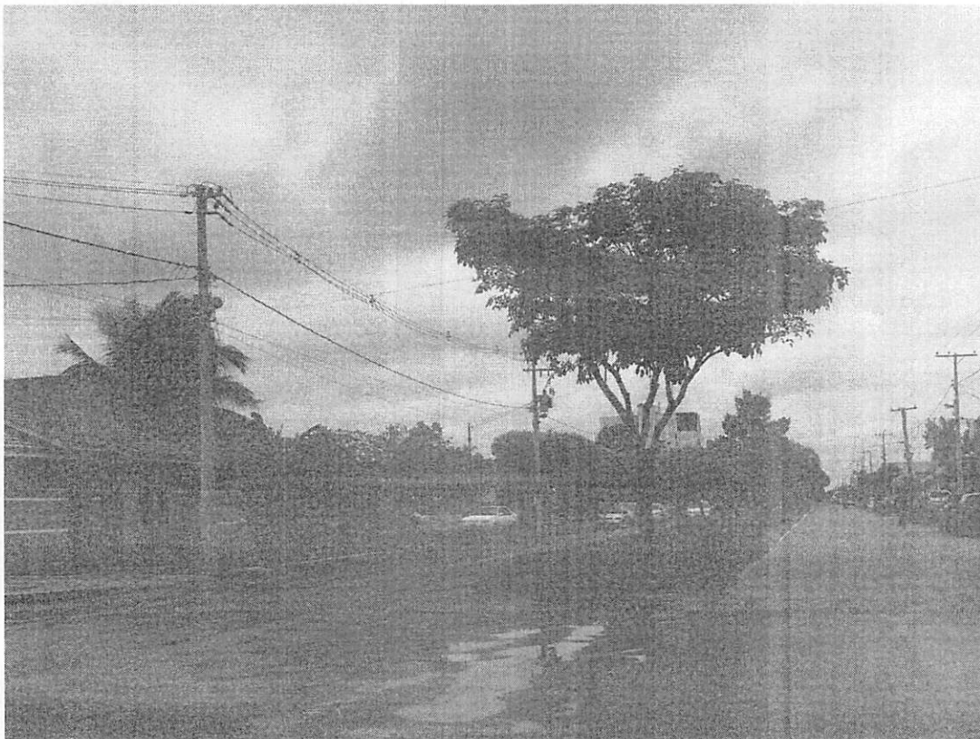
Figura 3 - Cruzamento da Av. Jacarandás com a Rua das Goiabeiras (Data: 11/04/2019).