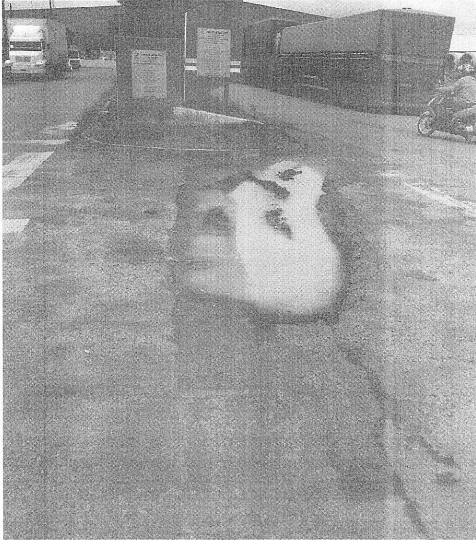
Figura 2 - Cruzamento da Av. Jacarandás com a Av. Joaquim Socrepa (Data: 11/04/2019).