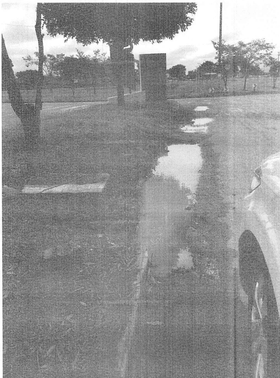
Figura 4 - Cruzamento da Av. Jacarandás com a Av. dos Flamboyants (Data: 11/04/2019).