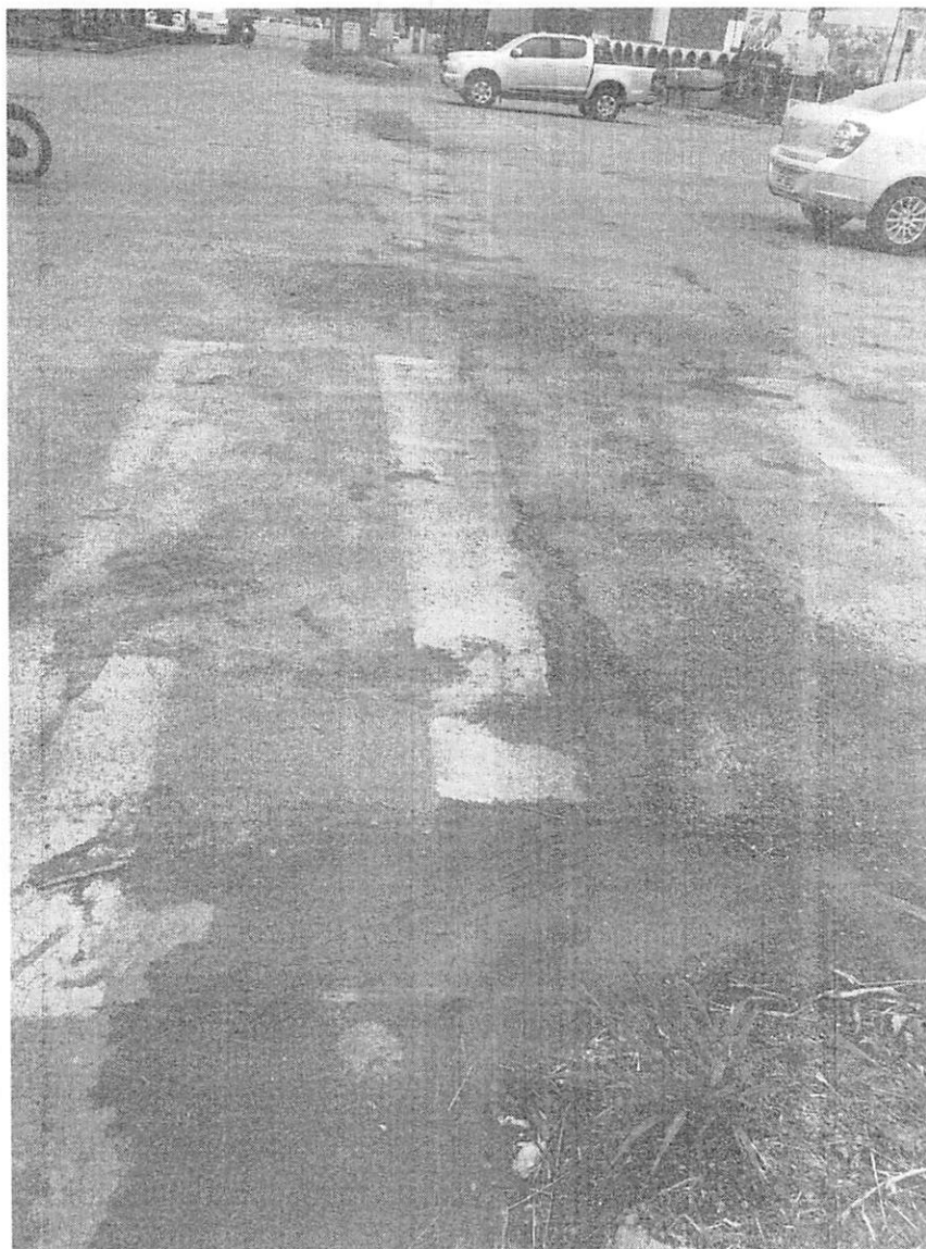
Figura 1 - Cruzamento da Av. Jacarandás com a Av. Joaquim Socrepa (Data: 11/04/2019).